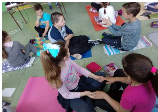
Zona de sentimento (des)agradável