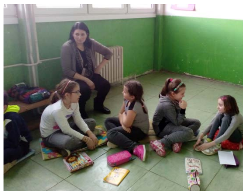
Conhecer os elementos do projeto