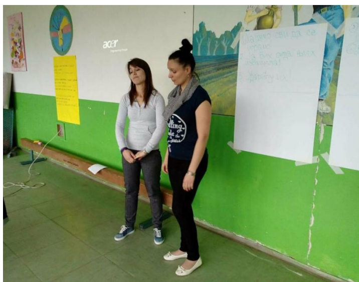
Como dizer "NÃO" - situação encenada