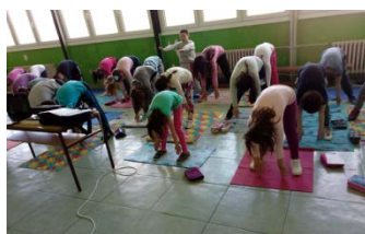
„Árvores caídas“ (Tai chia chuan)