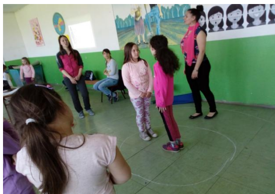
"Cruza os teus outros braços"

Confrontar as crianças com a comunicação não verbal (contacto visual, expressão facial, gestos, postura e atitude, distância); notar sinais não verbais que contribuem para uma comunicação saudável.