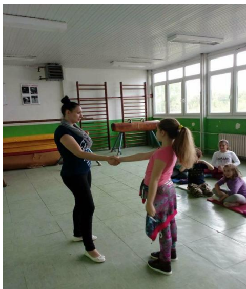
Primeiro encontro - primeira impressão

Praticar a primeira boa impressão. Dar às crianças ferramentas que lhes permitam lutar pelo seu lugar, defender a sua posição; lutas verbais com intimidadores (Bullies). Enfatizar a importância de exprimir opiniões e da comunicação.