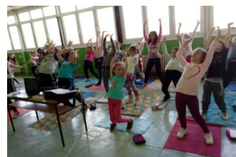
„Saudação ao sol“